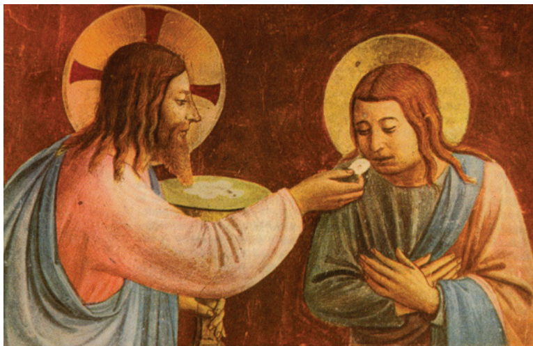
Fra Angelico (†1455): Ježíš Kristus podává sv. Přijímání sv. Janu Evangelistovi

ji ozývaly hlasy, volající po opravdových eucharistických kongresech, a to nejen národních.