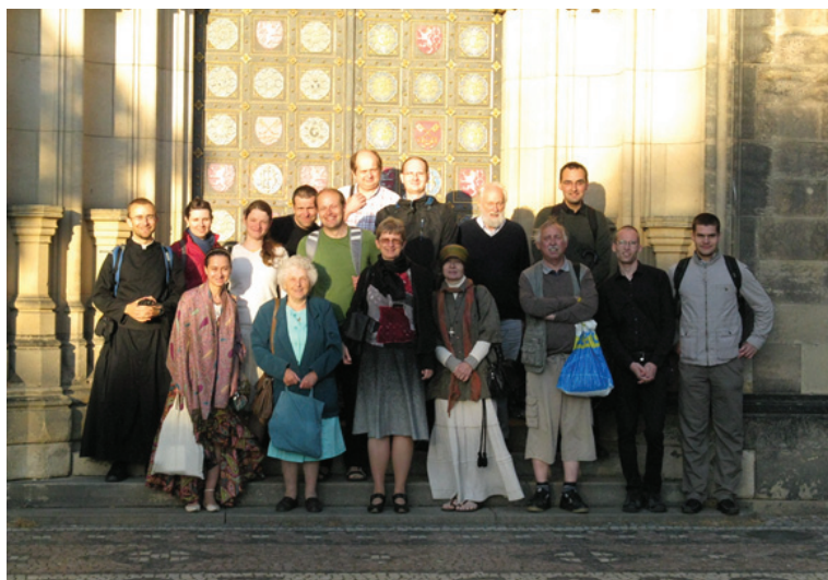
Účastníci exkurze na památný Vyšehrad