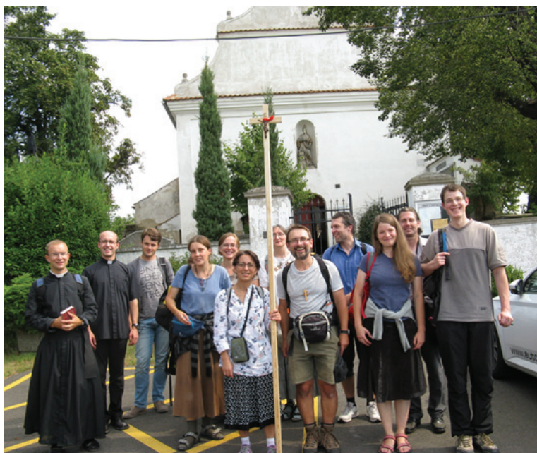
Před dubickým kostelíkem sv. Barbory (vlevo) a asistovaná Mše sv. v bohosudovské bazilice (vpravo)

Po skončení a rychlém rozloučení následoval úprk na vlak, který jsme všichni nestihli, což trochu kalilo můj dobrý pocit z vydařené pouti. Snad se i oni dostali dobře domů. Cestu vlakem jsme strávili vyprávěním našich životních zkušeností, zážitků a vzpomínek na naše společná putování i společnou večeři ve vlaku. Jen nerad jsem se loučil se skvělými spolupoutníky s nadějí, že se snad někdy brzo uvidíme.