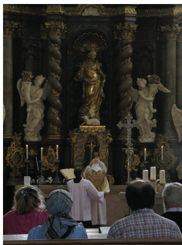
Mše sv. v břev- novském chrámu sv. Markéty

N a dvacet účastníků se sešlo počátkem července v břevnovském klášteře při druhém ročníku Hovorů o víře pod výmluvným názvem Credimus. Letošním tématem totiž bylo Krédo Božího lidu papeže bl. Pavla VI. Mše sv. a společná modlitba částí breviáře byly každodenním rámcem nabitého programu, který kromě přednášek zahrnoval i tematické vycház-