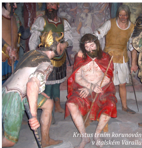
Kristus trním korunován v italském Varallu

Svaté hory (Sacri monti) je komplex devíti poutních míst v severní Itálii s kaplemi umístěnými v přírodě se sochami a malbami, představujícími pašijovou cestu Ježíše Krista nebo život Panny Marie. Nápadně se podobají Římovu. Nejstarší z těchto poutních míst Varallo, zvané Nový Jeruzalém, mohlo být inspirací pro římovskou pašijovou cestu. Více se o těchto místech lze dozvědět na www.sacrimonti.org .