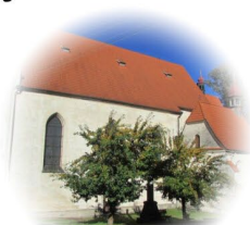
Stráž nad Nežárkou (mše svatá v 11:30)

Více informací a přihlášky: fssp.cz/pout-straz-rimov-26